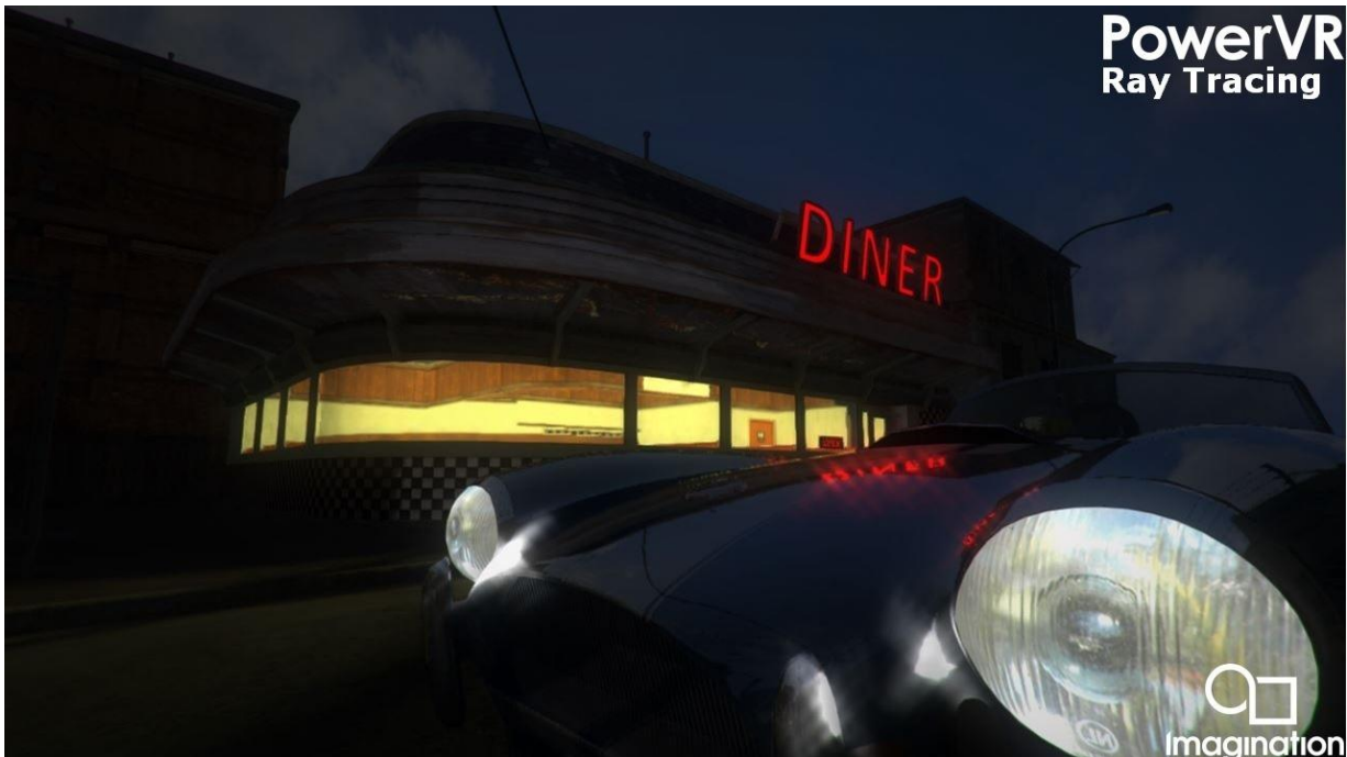
光柵化遊戲引擎中的混合光線跟踪

最近，對程式設計人員來說，繪圖技術創新又增加了光線追蹤這項功能。透過投入大量資金用於加速它的新硬體架構，並花費大量資金與遊戲開發人員一起充份發揮新硬體功能，Nvidia 已大大推動了即時光線追蹤加速技術。其他公司，包括我們，以前都曾嘗試推動此一技術，但由於沒有擁有如此龐大的資源，因此很難說服程式設計人員對我們的技術有興趣。